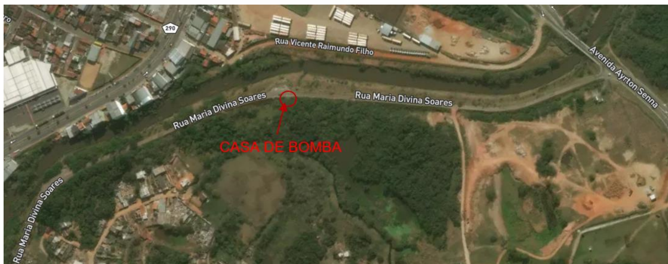
Figura 1 Localização da Nova Casa de Bombas - Diquinha