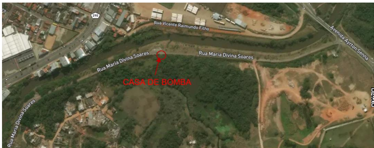
Figura 2 Localização da Nova Casa de Bombas - Diquinha

7.1. Os serviços serão executados no seguinte local: